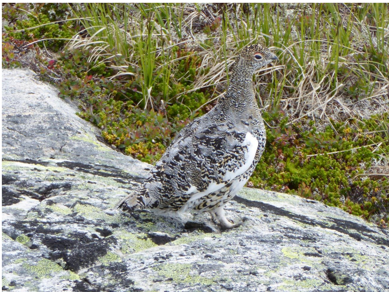
Ein av dei siste fjellrypene på Osafjellet?